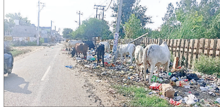
रोहतक। कहेली रोड के पास फैला कूड़ा, गंदगी में मुंह मारते हुए गोवंश।

■ गोवंश आज भी पहले की तरह सड़कों, बाजारों और कॉलोनियों में खुलेआम घूमता नजर आता है