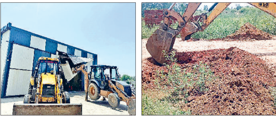
रोहताक। अवैध निर्माण गिरवते जिला नगर योजनाकार के कर्मचारी।

जिला प्रशासन द्वारा अवैध कॉलोनियों और निर्माणों के खिलाफ सख्त रुख अपनाने हुए मंगलवार गांव रोहताक और बहुजमालपुर में तीन एकड़ क्षेत्र में विकसित की जा रही दो अवैध कॉलोनियों में तोड़फोड़ अभियान चलाया गया। इस दौरान एक अवैध निर्माण के साथ-साथ कॉलोनियों का पक्का व कच्चा रोड नेटवर्क भी ध्वस्त कर दिया गया। जिले में अवैध निर्माण या अवैध कॉलोनियों को किसी भी हाल में पनपने नहीं दिया जाएगा। इस प्रकार के निर्माणों को गिराने की कार्रवाई लगातार जारी रहेगी और भविष्य में भी इसी तरह के अभियान चलाए जाते रहेंगे।